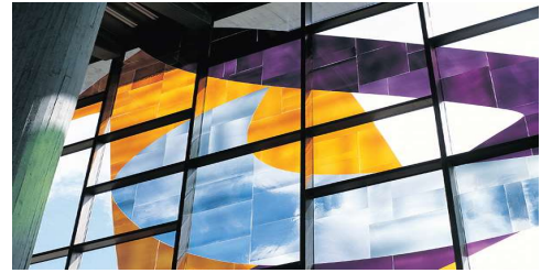
Station de métro Champs-de-Mars